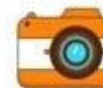
фото-, аудио- и видеоаппаратура